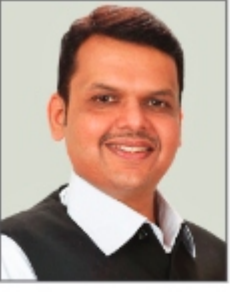
मा.श्री.देवेंद्र फडणवीस उपमुख्यमंत्री

निर्माण झालेली आर्थिक विकासाची केंद्रे याच्या समन्वयातून व विश्लेषणातून २५ जिल्हा लॉजिस्टिक नोड्स प्रत्येक जिल्ह्यात किमान २ ते ३ ठिकाणी एकूण १०० एकर क्षेत्रावर जिल्हा भूक्षेत्र संलग्न असेल किंवा जिल्ह्याची दोन-तीन प्रमुख उद्योग व्यापार व व्यवसायची ठिकाणे हब आणि स्पोक मॉडेल अंतर्गत जोडले जातील. जिल्ह्यातील एमआयडीसी क्षेत्रातील १५ टक्के क्षेत्र खाजगी क्षेत्रातील लॉजिस्टिक नोड्स साठी राखीव ठेवण्यात येतील.