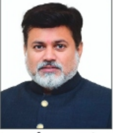
मा.श्री. उदय सामंत उद्योगमंत्री, महाराष्ट्र राज्य

राज्यामध्ये ११,६३१ किमीचे रेल्वेचे जाळे असून त्याअंतर्गत ५४८ रेल्वे गुड्स शेड्सचा समावेश आहे. सागरी आणि हवाई जोडणी अंतर्गत राज्यामध्ये दोन मोठी व ४८ लहान बंदरे, ५३ आंतरदेशीय कन्टेनर डेपो आणि कन्टेनर फ्रेट स्टेशन, ८ खासगी माल वाहतूक टर्मिनल आणि ११ एअर कार्गो टर्मिनल्स या सक्षम पायाभूत सुविधा उपलब्ध आहेत.