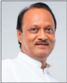
मा.श्री.अजित पवार उपमुख्यमंत्री

सध्या देशातील लॉजिस्टिक क्षेत्राचा भारताच्या सकल देशांतर्गत उत्पादनामध्ये १४ टक्के वाटा आहे. लॉजिस्टिक क्षेत्र २.२ कोटी लोकांना रोजगार पुरवते. देशामध्ये वार्षिक ४.६ अब्ज टन उत्पादनाची वाहतूक व हाताळणी याकरिता रु. ९.५ लाख कोटी इतका खर्च येतो. महाराष्ट्राचा यामध्ये मोठा वाटा असून, राज्यात १७,७५७ किमी लांबीचे राष्ट्रीय महामार्ग व २८,४६१ किमी लांबीच्या राज्य महामार्गासह राज्यामध्ये पायाभूत सुविधांचे विस्तीर्ण जाळे आहे. तसेच राज्यामध्ये ११,६३१ किमीचे रेल्वेचे जाळे असून त्यांतर्गत ५४८ रेल्वे गूड्स शेड्सचा समावेश आहे. महाराष्ट्र हे देशाच्या एकूण मूल्यवर्धित दरामध्ये १५.१ टक्के योगदान देऊन राष्ट्रीय अर्थव्यवस्थेत महत्त्वपूर्ण भूमिका बजावत आहे. औद्योगिकदृष्ट्या प्रगत राज्य म्हणून ओळख असणारे महाराष्ट्र आता जागतिक दर्जाचे लॉजिस्टिक हब म्हणूनही नवीन ओळख निर्माण करत आहे. - प्रतिनिधी