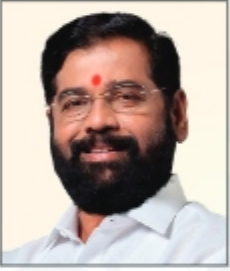
मा.श्री. एकनाथ शिंदे मुख्यमंत्री

मुख्यमंत्री एकनाथ शिंदे, उपमुख्यमंत्री देवेंद्र फडणवीस, उपमुख्यमंत्री अजित पवार आणि उद्योगमंत्री उदय सामंत यांनी ७ ऑगस्ट २०२४ रोजी झालेल्या मंत्रिमंडळ बैठकीत लॉजिस्टिक धोरणास मान्यता दिली. राज्य आर्थिक सल्लागार परिषदेने केलेल्या शिफारसीनुसार राज्याचे वर्ष २०२८ पर्यंत १ ट्रिलियन डॉलर अर्थव्यवस्था गाठण्याचे उद्दिष्ट ठेवण्यात आले आहे. ते गाठण्यासाठी नवीन लॉजिस्टिक धोरण महत्त्वपूर्ण भूमिका बजावणार आहे. केंद्र शासनाच्या नॅशनल