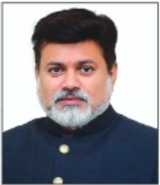
मा.श्री. उदय सामंत उद्योगमंत्री, महाराष्ट्र राज्य