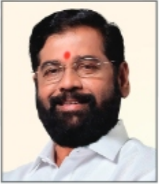
मा.श्री. एकनाथ शिंदे मुख्यमंत्री